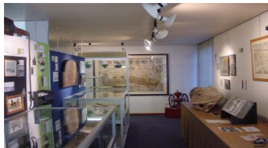
expositie Stolpboerderijen 2003 in Zijpermuseum te Schagerbrug