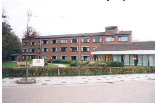
zorgcentrum de Zandstee te 't Zand

Voor ouderen zijn er in veel dorpen voorzieningen in de vorm van ouderensociëteiten. Verder wordt er een maaltijdvoorziening, alarmering, een 65+-pas en de Seniorenbus aangeboden. Callantsoog kent een woonzorgcomplex, 't Zand een zorgcentrum en in Petten wordt momenteel onderzoek gedaan naar de vestiging van een Woon en Zorg combinatie. Desondanks is er een tekort aan huisvestingsmogelijkheden voor ouderen met enige zorgbehoefte. In de toekomst wil men komen tot het aanwijzen en organiseren van woonzorgzones in enkele dorpen waarbinnen alle faciliteiten voor ouderen gegarandeerd worden aangeboden. Voor verpleeghuis- en geriatrische zorg is men voorlopig nog aangewezen op de omliggende grote plaatsen, hoewel het in de toekomst beleid is om binnen ieder zorgcentrum, zoals in 't Zand, ook een aantal verpleeghuisbedden te exploiteren.