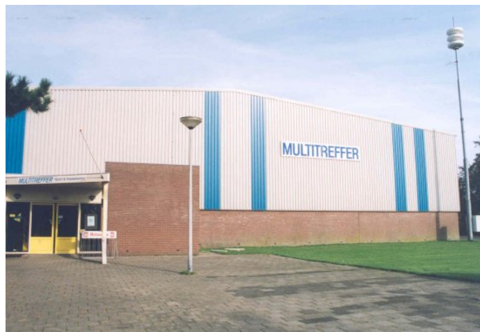
multifunctioneel gebouw Multitreffer in 't Zand

In verschillende kernen worden voorzieningen geclusterd. Hierdoor ontstaat langzaam maar zeker een multifunctioneel gebruik van voorzieningen zoals dorpshuizen en voormalige kerken. Een vraagstuk hierbij vormt het beheer en de zeggenschap nu de ruimte door meerdere verenigingen en activiteiten gedeeld wordt.