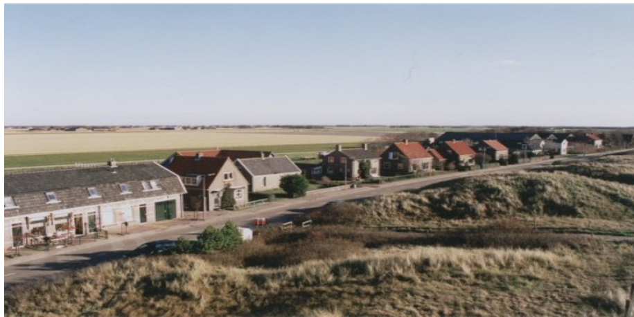
Helmweg te Groot Keeten