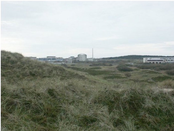
Hoge Flux Reactor te Petten

Het gemeentebestuur zal vroegtijdig initiatieven ontwikkelen om de eventuele vervanging van de Hoge Flux Reactor te bevorderen. Mocht onverhoopt besloten worden om, op termijn, de reactor te sluiten en geen nieuwbouw te plegen, dan zal zo spoedig mogelijk na die besluitvorming met de daarvoor verantwoordelijke instanties gesproken gaan worden over vervangende werkgelegenheid.