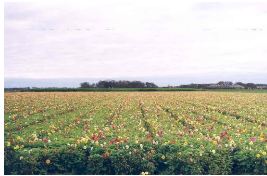
bloembollenvelden Korte Bosweg

Bij een kwaliteitsslag in de recreatie en de uitbreiding van het bloembollenareaal kunnen strijdige belangen optreden. Te denken is daarbij aan zowel de gewenste natuurlijke aankleding van een gebied, als aan het gebruik van gewasbeschermingsmiddelen. Een geleidelijke overgang van duinen naar polderland, het landschappelijk aankleden van wegen en het vergrootten van de mogelijkheden van wandelen, fietsen en watersport zal weliswaar het recreatieve product verbeteren maar tegelijkertijd de omstandigheden voor de bollenteelt niet bevorderen. Bovendien, de door de reconstructie vrijkomende agrarische gebouwen die in de buurt van de kust staan, kunnen moeilijk voor de recreatie worden ingezet wegens de verschillende milieueisen.