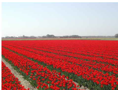
tulpenvelden in de Zijpe

Voorts liggen er mogelijkheden voor de landbouwsector in het landschapsbeheer. Maar dit zal waarschijnlijk niet voldoende loonvormend zijn, wel kan het een belangrijke nevenfunctie uitoefenen, door de bestaande agrarische bedrijven. Het is dus als nevenactiviteit wel degelijk interessant voor agrarische bedrijven.