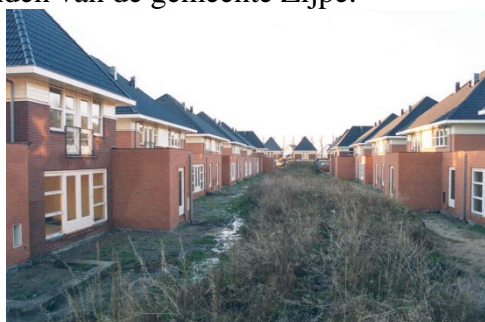
Hoenderpark te Schagerbrug

Een andere mogelijkheid is om luxe en minder luxe verzorgingsappartementen voor ouderen in bijvoorbeeld 't Zand, Callantsoog en Petten aan jongeren en starters aan te bieden. Hierdoor kan er soms een doorstroming van twee of drie mutaties ontstaan binnen het bestand woningzoekenden van de gemeente Zijpe.