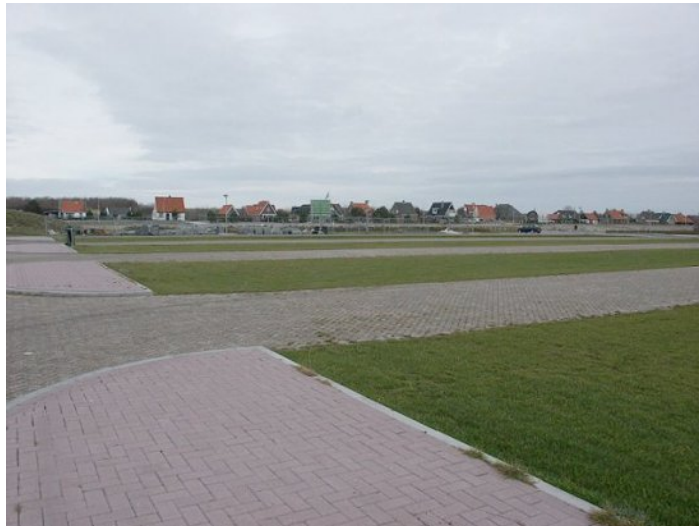
parkeerterrein in Groote Keeten

Het parkeren bij de kustdorpen wordt reeds lange tijd met name in het hoogseizoen als problematisch ervaren. Om te voorkomen dat er onnodig verkeer door de dorpen wordt geleid, dan wel dat de woongebieden aangewend worden voor parkeren ten behoeve van strandbezoek, wordt er gestreefd naar de aanleg van of uitbreiding van parkeervoorzieningen aan het einde van de ontsluitingswegen, zo dicht mogelijk bij de strandopgangen, zodat strandbezoekers te voet het strand kunnen bereiken. Het aanleggen van transferia aan de N9, waarbij alternatief vervoer naar de kust zou moeten worden geregeld, wordt niet realistisch geacht.