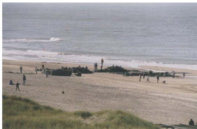
herstel strekdammen Callantsoog/Grootte Keeten