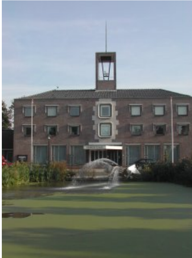
gemeentehuis in Schagerbrug