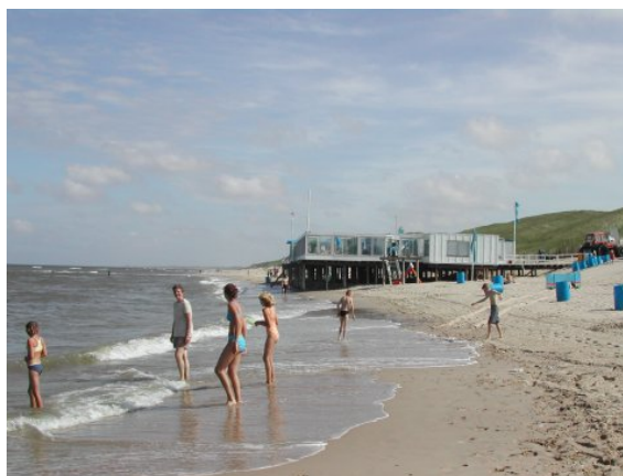
recreatie aan een van de Zijper stranden

Voor de toekomst is de sector toerisme en recreatie naast de sector landbouw de belangrijkste economische pijler. Geconstateerd wordt, dat een deel van de recreatiewoningcomplexen en (de kleinere) campings in de gemeente Zijpe dreigt te verouderen, waardoor zij niet (meer) aan de vraag naar een hoogwaardig voorzieningenniveau kunnen voldoen. Ten aanzien van deze accommodaties zal de komende jaren een kwaliteitsslag gemaakt moeten worden om de huidige bezettingsgraad te kunnen blijven verhogen. Hierbij kunnen zowel de gemeentelijke verordeningen voor recreatiewoningen van maximaal 70 m 2 als voor minimaal twaalf weken verhuur van een recreatiewoning een drempel opwerpen voor een rendabele vernieuwing. Overigens kan tevens worden vastgesteld, dat in vele situaties de afgelopen decennia veel geïnvesteerd is om te kunnen voldoen aan de stijgende vraag naar meer luxe en comfort. De recreatiesector in Zijpe heeft daarnaast te kampen met een relatief kort midden- en hoogseizoen van ongeveer 16 weken in mei, juni, juli en augustus. De tot nu toe uitgevoerde pogingen hebben niet het hoogseizoen daadwerkelijk verlengd. Dit komt mede door het ontbreken van voorzieningen en attracties van enige allure die ook bij slecht weer en in de winter zijn te gebruiken. Maar ook de beperkte naamsbekendheid van de gemeente Zijpe als kustgemeente speelt hierin mogelijk een rol.