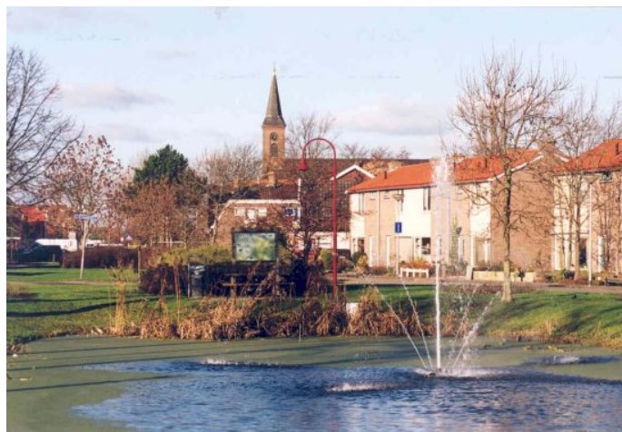
dorpsplein in 't Zand

Het dilemma dat mogelijk de komende jaren gaat ontstaan is dat de gemeente Zijpe op de langere termijn blijft bestaan uit acht matig ontwikkelde dorpen. Matig in de zin dat de inwoneraantallen langzaam terug lopen, de bevolking vergrijsst en het voorzieningenniveau afneemt. Een oplossing voor dit dilemma kan zijn het kiezen van één of twee dorpen als groeikern(en) met mogelijkheden voor grootschalige nieuwbouw en de daarbij behorende voorzieningen.