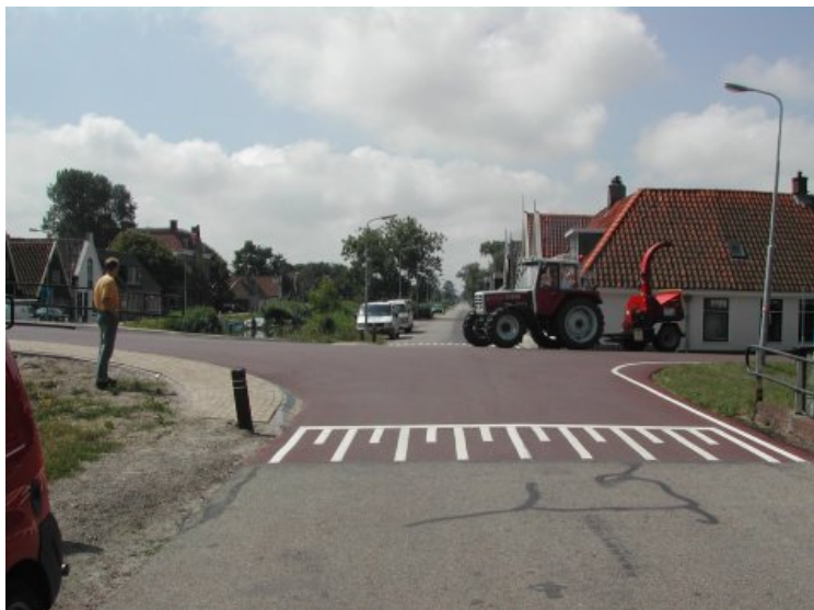
in het kader van duurzaam veilig, nieuw aangelegde kruising in Schagerbrug

Voor de verkeersveiligheid binnen alle kernen van de gemeente worden de gemeentelijke wegen volgens plan de eerst komende jaren aangepast aan de principes van het “Duurzaam veilig” concept met een variatie aan verkeersmaatregelen.