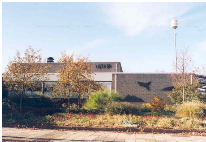
dorpshuis de Uijkijk te Sint Maartensbrug