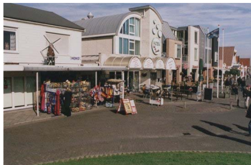
winkels te Callantsoog