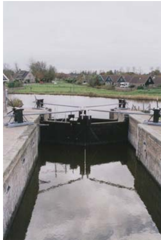
de Groote Sluys te Oudesluis met op de achtergrond Zijper Eiland