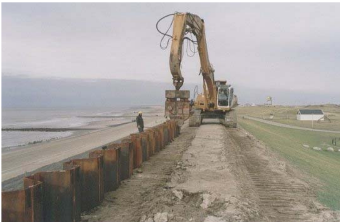
dijkverhoging in Petten d.m.v. aanbrengen van damwandprofielen

De ontwikkeling van het plan voor de realisering van een zeejachthaven bij Petten (Marina Petten) kan worden gezien als een voorloper voor de ontwikkeling van een zeewaartse kustverdediging. Immers, de verwachting is gerechtvaardigd dat de aanleg van pieren in zee een natuurlijke zandsuppletie op gang zal brengen welke mogelijk de verhoging/verbreding van de huidige zeewering onnodig zal maken. Daarmee worden met de uitvoering van een dergelijk plan meerdere doelen tegelijkertijd gediend: het op een aanvaardbaar niveau brengen van de kustverdediging, alsmede het verder ontwikkelen en upgraden van het toeristisch/recreatief product in onze gemeente (c.q. de Kop van Noord-Holland).